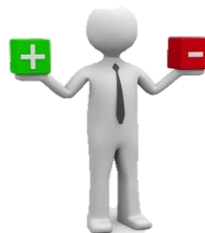
Studentska anketa lj.s.2023./2024.